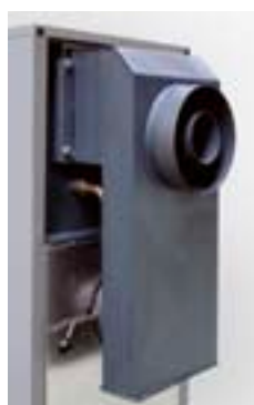
2 cámaras de combustión con 1 única salida de chimenea