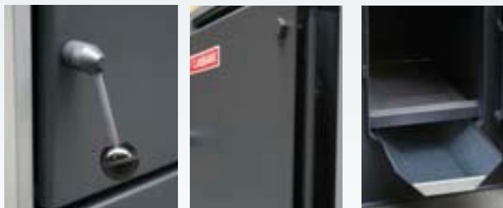
Detalles de cierre y bisagra